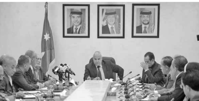
وأشار البكار إلى أن هناك قضايا حولت للهيئة، وقضايا حفظت بناء على إجراءات التصويب التي تم اتخاذها، مؤكداً أن أي مخالفة لا يمكن حفظها إلا إذا رافقها قرار متعلق بتصويب المخالفة أو اتخاذ

وبيّنت سفيرة الاتحاد الأوروبي لدى الأردن ماريلا هادجيتو دوسيو دور الاتحاد في تطوير التشريعات التي تحمي من مخاطر التغير المناخي، وتبادل الخبرات والتجارب بين دول بحر الحوض الأبيض المتوسط بهدف تطوير الاستثمار في هذا القطاع، مؤكدة أهمية الإعلام