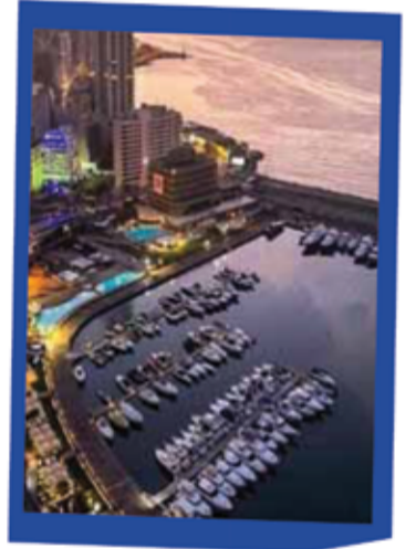
بيروت 269 دينار

دجوزات فنادق إلى المقبة والبحر الميت دجوزات فنادق لجميع أنحاء العالم