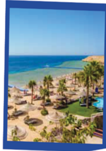
شرم الشيخ 169 دينار