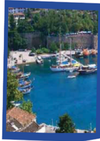
انطاليا 349 دينار