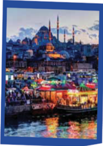
اسطنبول 249 دينار