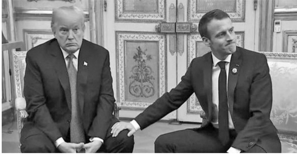
واشنطن هددت الولايات المتحدة، الليلة الماضية، بزيادة الرسوم الجمركية بنسبة ١٠٠ بالمئة على سلع فرنسية بقيمة ٢,٤ مليار دولار، ردا على فرض فرنسا ضرائب إضافية تمييزية على عمالقة الإنترنت "غوغل" و"أمازون" و"فيسبوك" و"أبل". وستطالب الرسوم الجمركية الإضافية، التمييز والأجبان اعتبارا من منتصف كانون الثاني بعدما اصتبر تقرير صادر عن مكتب الممثل التجاري الأميركي "غافا" (الحرف الأول من أسماء الشركات الكبرى غوغل وأمازون وفيسبوك وأبل) تعاقب المجموعات الرقمية الأميركية العملاقة. وحذر الممثل التجاري الأميركي، روبرت لايتهازير، من أن واشنطن تبحث إمكان التوسع بالتحقيق للنظر في ضرائب مماثلة تفرضها النمسا وإيطاليا وتركيا. ورسم "غافا" مفروض على الشركات الكبرى في القطاع، ولكنه لا يتعلق بإرباحها المعززة في دول تكون برقم الأعمال، بانتظار تكثيف القواعد الاقتصادية.