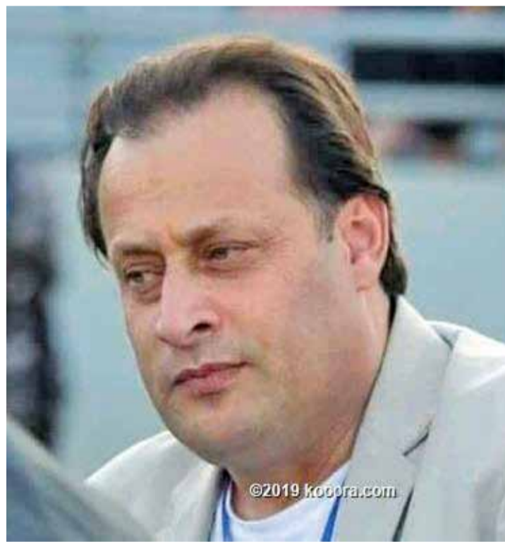
تعلم بالعقوبة منذ حينه، وفي حال سدنا تلك المبالغ لأصحابها وحصلنا على الشكاوى، فإن فيفا سيقوم مباشرة بفتح المخالصات المالية من محامي أطراف