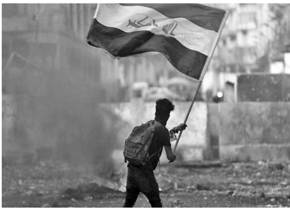
واشنطن دان مساعد وزير الخارجية الأميركي للشرق الأوسط ديفيد شينكس، الاثنين، الاستخدام "المروع والشنيع" للقوة ضد المتظاهرين في مدينة الناصرية جنوبي العراق، وطالب بالتحقيق في الانتهاكات التي وقعت بحق المحتجين، بحسب قناة فوكس نيوز الإخبارية. وقال شينكس "ندعو الحكومة العراقية إلى التحقيق ومحاسبة أولئك الذين يحاولون ان يكتموا بوحشية افواه المتظاهرين السلميين.. وكانت قوات الأمن العراقية قد فتحت النار على متظاهرين أغلقوا جسرا ثم تجمعوا أمام مركز للشرطة في مدينة الناصرية بالجنوب، ما أودى بحياة ما لا يقل عن ٢٩ شخصا، واصابة العشرات، بحسب مصادر أمنية وطبية في بغداد. وقتلت القوات العراقية أكثر من ٤٠٠ شخص معظمهم من المحتجين الشبان العزل منذ تفجر الاحتجاجات المناهضة للحكومة في الاول من تشرين الاول الماضي، ولقي أيضا أكثر من ١٢ من قوات الأمن مصرعهم في الاشتباكات مع المتظاهرين.

الخطار صادر عن دائرة تنفيذ شرق عمان رقم الدعوى التنفيذية : ٢٠١٩/٢٥٨٦ إسم المحكوم عليه/ المدعى : خالد وليد رجب كنان عنوانه : عمان /إلحاح العلي رقم الاعلام/السند التنفيذي ٧٩.٤٢٧ محل صدور : تنفيذ شرق عمان المحكوم به الدين : ١٢٨٨٠ دينار والرسوم والمصاريف والتعاب المحاماة ان وجدت والغرامة ان وجدت يجب عليك ان تؤدي خلال خمسة عشر يوما تلي تاريخ تبليغ هذا الاخطار الى المحكوم له الدائن شركة عبر الحدود للتسويق والسياحة والسفر البيع المميز اعمال واذا انقضت هذه المدة ولم تؤد الدين المذكور او تعرض التسوية القانونية ستقوم دائرتنا بتنفيذ مباشرة المعاملات التنفيذية اللازمة قانوناً بحسب ماورد في التنفيذ شرق عمان