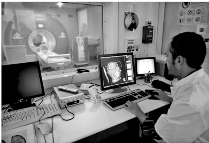
قيد الحياة بفضل الأوكسجين والجلوكوز فقط. ولا يستغرق الدماغ سوى ثلاث إلى خمس دقائق ليعاني من ضرر لا رجعة فيه حين يحرم من الأوكسجين والجلوكوز. وتطرق الموقع، سادسا، إلى أن هناك أشخاصا يمكنهم سماع الألوان أو شم الكلمات وهو ما يسمى "التصاحب الحسي" الذي تم اكتشافه للمرة الأولى في القرن ١٩، حيث أن هذا الخلط بين الحواس يعد حالة إدراكية. وعلى الرغم من أن "التصاحب الحسي" قد يكون سببه صدمة دماغية، إلا أن العديد من الأشخاص يظهرون أعراض هذه الحالة منذ سن مبكرة. وأورد الموقع أن الحقيقة السابعة تتمثل في أن الأمر لا يستغرق سوى ٢٠

ثانية كي تنق في أحدهم، حيث يقول العلم إنه إذا ما تقلبت شخصًا ما لمدة ٢٠ ثانية، فسيفعل ذلك شعورا بالثقة. وعندما تشعر بالامان، يطلق جسمك هرمون "الأوكستوسين" وهو الهرمون ذاته الذي يتم إطلاقه عندما تعانق أحدهم، أما الحقيقة الثامنة فهي أن المال يمكنه شراء السعادة. في الواقع، عندما تنفق المال على غيرك يجعلهم سعداء، فذلك يؤثر على تقديرك لذاتك على نحو إيجابي. وستبدأ برؤية نفسك كشخص أكثر أهمية وكل ذلك يجعلك سعيدا. وأفاد الموقع، تأسعا، أن الأوعية الدموية في دماغك تمتد على حوالي ١٢٠ ألف ميل، وهو طول يعادل منتصف الطريق إلى القمر. وتمثل الحقيقة العاشرة في أن فترة الانتباه لديك لا تتجاوز ٤ ثواني وهي أقصر مما كانت عليه قبل ١٥ سنة، وهو ما يعني أننا عاجزون عن التركيز على أمر واحد لأكثر من ٨ ثواني في كل مرة. في المتوسط، وأوضح الموقع أن الأكتئاب يعد أكثر انتشارا في صفوف الشباب، حيث أن دراسة حديثة كشفت عن أن أكثر الأشخاص تعاسة في العالم تقل أعمارهم عن ٣٠ سنة، ويعتبر الرجال والنساء الذين تتراوح أعمارهم بين ١٨ و٣٠ سنة هم أكثر عرضة للقلق والتوتر. وفي الختام، بين الموقع أن اللحم الواصي أو الصلبي يعتبر حقيقيا حيث أنه في هذا النوع من الأحلام يمكن للشخص التحكم في نتيجة أحلامه.