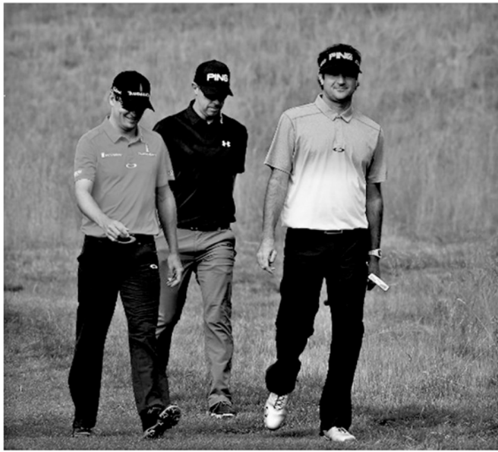
على جهاز المشي بعد نهاية الساعة الأولى، والثالث كالثاني، لكن مع إضافة ثلاث دقائق من المشي لاحقا خلال اليوم. تم العثور على أن المشي للرجال والنساء خفض ضغط الدم الانقباضي، الذي يعد مؤشرا قويا لمشاكل القلب.

اقرأ أيضا: تعرف إلى التغييرات التي تحدث في الجسم كل ١٠ سنوات كما أن النساء استخدمن على وجه الخصوص من الجولات الإضافية القصيرة. كما أظهرت دراسة نشرت في دورية جمعية القلب الأمريكية لضغط الدم، مؤلفها الرئيسي مايكل ويلر، أن كبار السن قد يستفيدون بشكل خاص من التمارين الصباحية. ويقول العلماء أن صعود الدرج أو غسل السيارة أو حمل أغراض التسوق كلها أمور يمكن أن تعزز من الصحة، خاصة للأشخاص الذين يعانون من السمنة، كما أن الأعمال المنزلية البسيطة أيضا مفيدة. وقال البروفيسور إيمانويل ستاماتيكس من جامعة سيدني "إن النشاط العرضي العادي يجعلك تلهث حتى لو لم تكن تأثر شوان في اليوم، يمكن أن يكون له تأثير واعد على صحتك، كما أن النظام الرياضي المعروف باسم HIIT يمكن لعظم الناس تحقيقه". ووجدت دراسة استرالية في العام الماضي أن دقيقتين من HIIT فعالة بقدر نصف ساعة من التمارين الرياضية الهوائية المعتدلة.