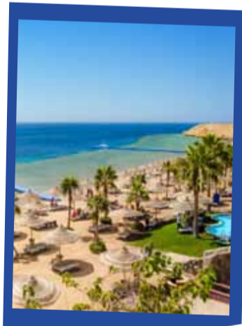
شرم الشيخ 169 دينار