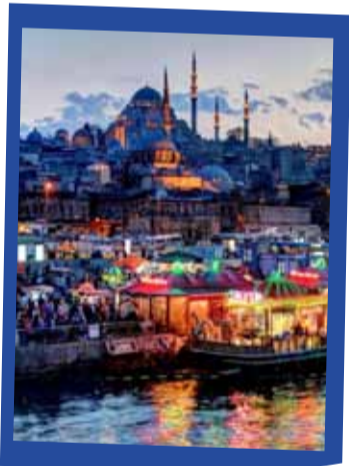
اسطنبول 249 دينار