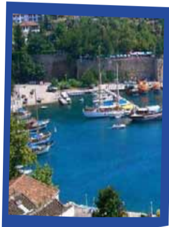
انطاليا 349 دينار