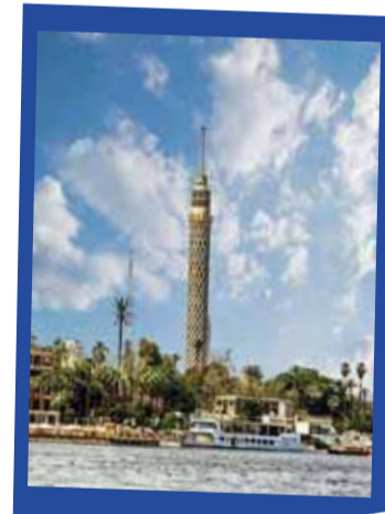
القاهرة 269 دينار