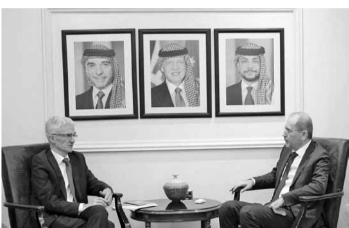
تتعاظم الجهود الدولية المستهدفة إيجاد الظروف اللازمة لعودة عن طريق التوصل

لحل سياسي للأزمة واستعادة سوريا لأمنها واستقرارها وتثبيت الاستقرار من خلال الإسهام في توفير متطلبات العيش الكريم إلى أن احتياجنا للاجئين تقيرت من مساعدات إغاثية إلى برامج تنموية في الدول المضيفة بعد حوالي تسع سنوات من بدء الأزمة، مؤكدا أهمية تطوير برامج عملية فاعلة لتمكين المجتمعات المحلية المستقبلية للاجئين. وشكر لوكوك الأردن على ما يقوم به من دور إنساني كبير وتمتيز في تحمل أعباء الجوع، ومُن تعاون المملكة مع الأمم المتحدة ومنظمتها. وقال إن الأردن يقدم أنموذجا في إنسانية تعامله مع اللاجئين، مؤكدا إسناد المنظمة الدولية له في ما يقوم به من جهود لتوفير العيش الكريم لهم.