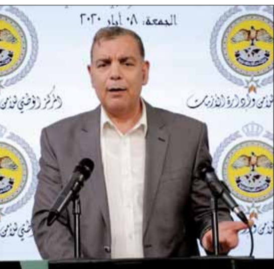
العمدة، ٠٨ أيار، ٢٠٢٠

عمان اعلن وزير الصحة الدكتور سعد جابر تسجيل ٢٤ اصابة بفيروس كورونا في المملكة امس ليرتفع اجمالي حالات الاصابة الى ٥٠٨ اصابات .