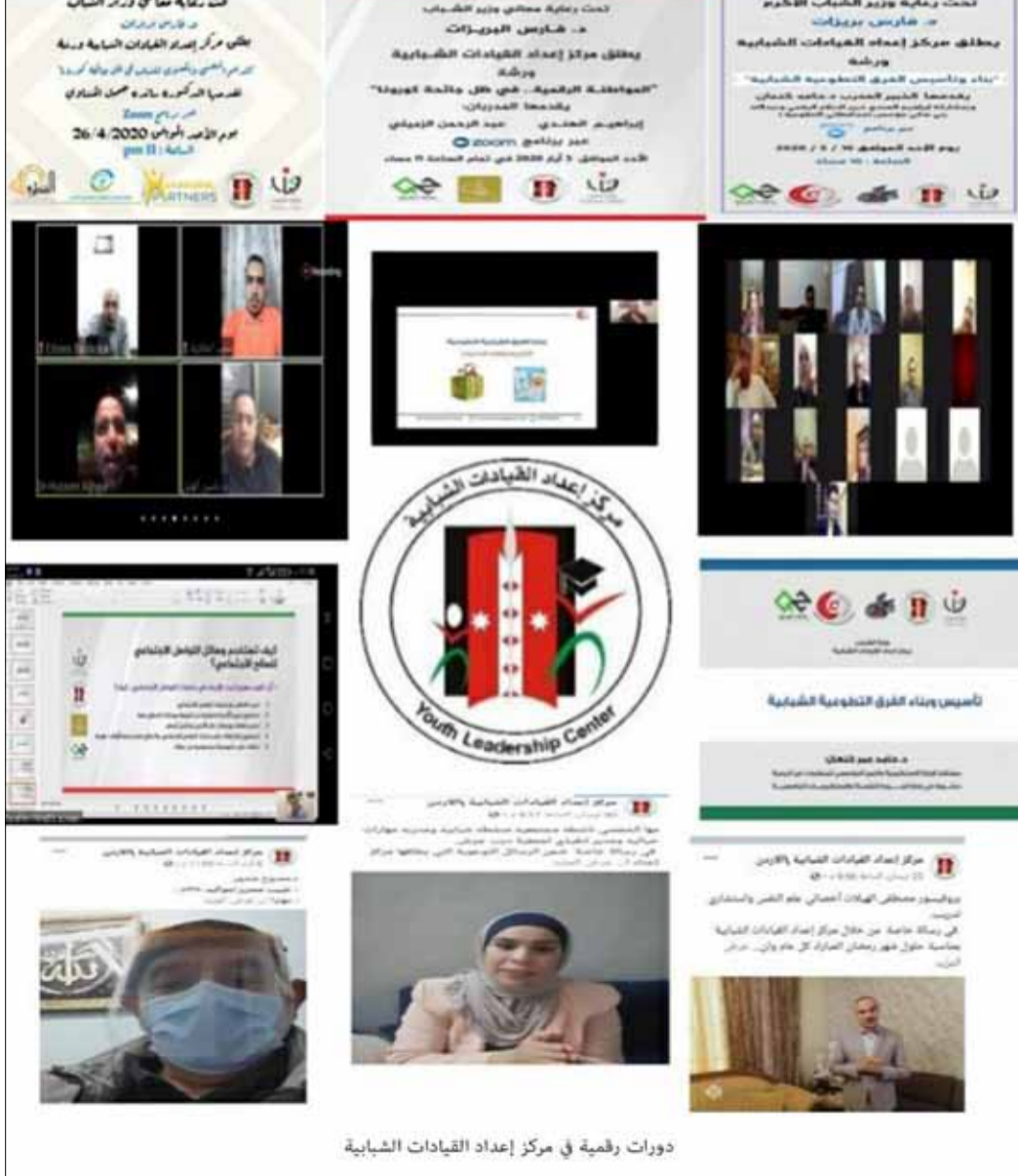
دورات رقمية في مركز إعداد القيادات الشبابية

أكد مصرفيون محافظا الإجراءات التي اتبعتها البنك المركزي والبنوك العاملة في الأردن، في مواجهة آثار جائحة كورونا على الاقتصاد الوطني، مشيرين إلى أن هناك حيزاً واسعاً ضمن السياسات النقدية والمالية لاتخاذ المزيد من الإجراءات للتخفيف من آثار الأزمة على الأسر والشركات الصغيرة والمتوسطة. وأشار المصرفيون، في ندوة نظمتها جامعة عمان العربية، بعنوان (استجابة النظام المصرفي الأردني لتداعيات أزمة كورونا، دروس وعبر)، إلى أن برنامج تمويل الشركات الصغيرة والمتوسطة الذي أعلنته الحكومة بقيمة ٥٠٠ مليون دينار، في بداية الأزمة كان لضمان التدفق النقدي للشركات المتضررة منها، وليس "من باب منح الهبات لشركات متعثرة قبل الأزمة".