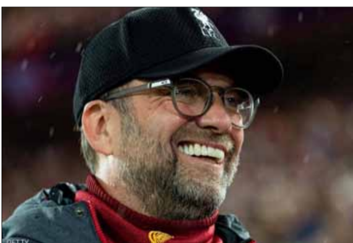
وعبر كلوب عن توقه للعودة إلى "الحياة الطبيعية" في أسرع وقت، بعد توقف غير متوقع لتهنيرين بسبب تفشي الفيروس في إنجلترا والعالم.

وقال كلوب الذي سيبدأ فريقه بالتدرب في مقر "ميلود" بمجموعات صغيرة الإغلاق كان جيداً قدر الإمكان، ليس تماماً ما أرغب بالقيام فيه، لكننا يجب أن نقوم بذلك جميعاً لتستفيد منه. وتابع، "بدأنا قبل ٨ أسابيع وتشعر الآن أن الجميع توافقون لاستعادة حياة طبيعية.. وأردف "اشتقت للشباب (لاعبي الفريق) لأننا صنعنا هنا مجموعة مرتبطة بعلاقة جيدة، وأصبحنا أصدقاء في آخر ٤ سنوات ونصف السنة.. وعن اللقاءات في فترة كورونا، قال