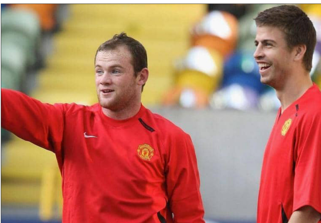
الدوري الإنجليزي الممتاز.. وعاد بيكيه إلى الفريق الكتلوني عام ٢٠٠٨، وهناك نجح في الانتقام من فريقه عامي ٢٠٠٩ و٢٠١١.