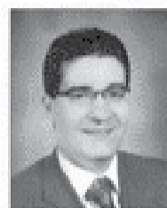
سعادة البروفيسور أشرف دوايه رئيس الأكاديمية العربية للتعليم والاقتصاد الإسلامي بالعراق