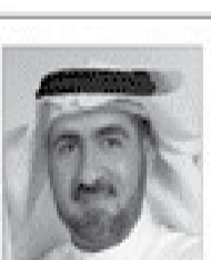
سعادة الدكتور غالب أحمد الزواوي مدير إدارة الشؤون الإسلامية بمصر، رئيس الهيئة الاستشارية للشريعة في كلية الشريعة (بغداد) العراقية