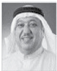
سعادة البروفيسور يوسف هيدا الغفار رئيس مجلس إدارة الشبكة الإقليمية المصرفية الإسلامية عبر العالم العربي للتربية الصناعية، رئيس الهيئة الاستشارية لائتلاف البنوك المصرفية الإسلامية والرئيس الفخري للمؤتمر