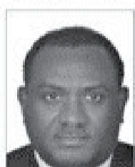
سعادة الدكتور زكريا قاسم كبير الاقتصاديين مستشار الشؤون الإسلامية للتنمية البنوك الإسلامية للتنمية