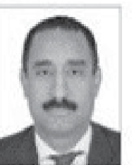
سعادة الدكتور هاشم حسين رئيس مكتب ترويج الاستثمار والتكنولوجيا في منظمة الأمم المتحدة للتنمية الصناعية الوطني، شريف الشرف