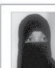
سعادة الدكتور حياة يوسف ملاوي رئيسة مركز الأبحاث للتدريب والاستشارات بالشبكة الإقليمية المصرفية الإسلامية بالمملكة العربية السعودية