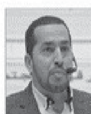
سعادة المستشار عبد السلام الخطيب رئيس مجلس العربي للبنوك الإسلامية والشريعة في الكويت