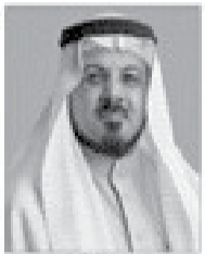
فضيلة الشيخ الدكتور أسامة بن عقوبة الرقبة الشريفة بني الامان