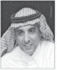
سعادة الدكتور هاني بن علي الحليان رئيس مجموعة التمويل الإسلامية بنك الجزيرة - المملكة العربية السعودية

الخبراء والمتحدثون في مؤتمر وجائزة المؤسسات المالية والمصارف الإسلامية الخامسة للشراكة والمسؤولية المجتمعية لعام 2020م