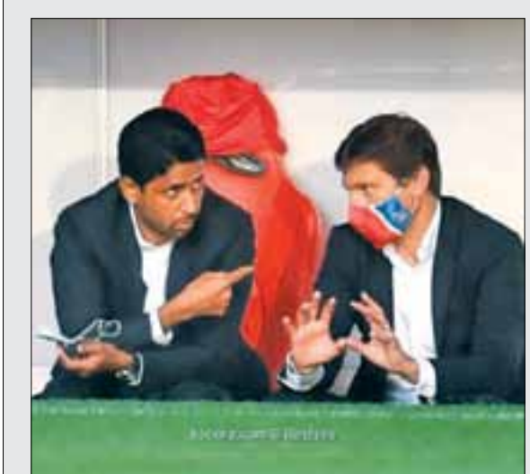
توماس توخيل مدير باريس سان جيرمان في اجتماع مع مسؤولي النادي.

قدم باريس سان جيرمان موسماً استثنائياً بتحقيقه الرباعية المحلية، إضافة إلى الوصول لنهاية دوري أبطال أوروبا لأول مرة في تاريخه، قبل خسارة اللقب بصعوبة أمام بايرن ميونخ الألماني. إلا أن احتفالات النادي الباريسي بمرور ٥٠ عاماً على تأسيسه، والاحتفاء بالنتائج والعروض القوية التي قدمها الفريق محلياً وقارياً، أجبقتها أزمة عالية يتفشي فيروس كورونا، الذي أحدث خلا اقتصادياً للأندية الأوروبية الكبيرة. وأربكت أزمة كورونا بدورها أجندة ليوناردو المدير الرياضي للنادي الباريسي، وضت تركيزه، وهو ما بدأ واضحاً في تحركه الضعيف لتدعيم الفريق بصفقات جديدة، وما تبعه من شكوى متكررة لمدير الفريق، توماس توخيل.