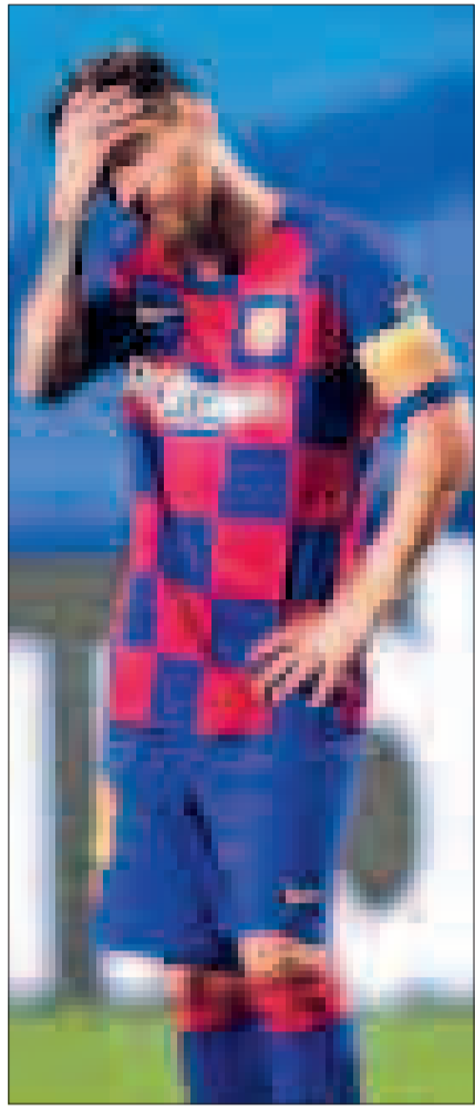
راتبه أثناء تواجد جوسيب ماريا بارتميو على رأس مجلس إدارة برشلونة.