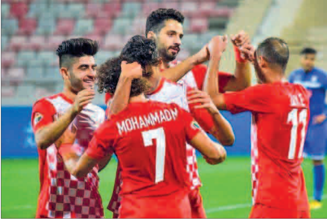
يحتسبها حكم المباراة ضربة جزاء، نفذها اللاعب نفسه بنجاح لتنتهي المباراة بهذا الفوز تقدم شباب الأردن للمركز التاسع برصيد ١٣ نقطة، وبقي الصريح ثامنا برصيد ١٤ نقطة.