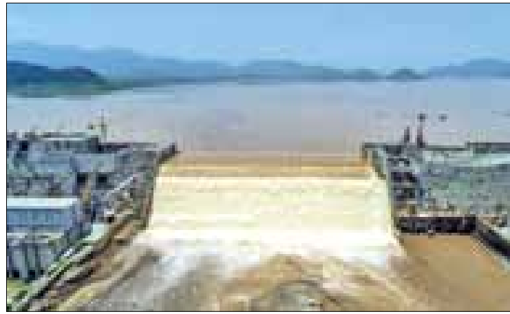
المياه". وتابع: "إذا فشلت مساعي توسيع المفاوضات فمن حقنا استخدام كل السبل المتوفرة للدفاع عن أمننا القومي التي تكفلها القوانين الدولية".