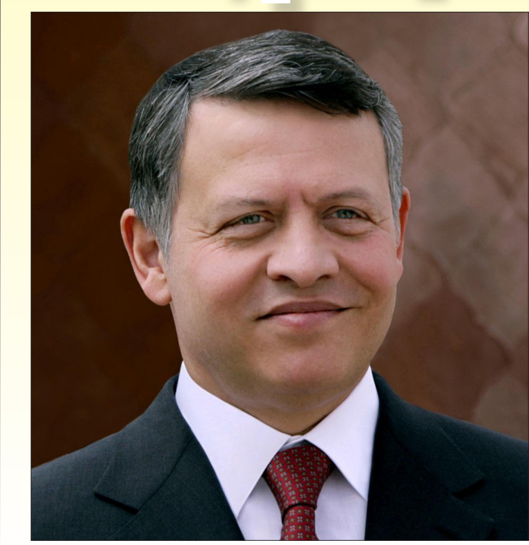
عمان - أعلن رئيس الوزراء العراقي مصطفى الكاظمي الجمعة، عن تأجيل القمة الثلاثية الأردنية - العراقية - المصرية المنوي عقدها في بغداد اليوم السبت.

وقال الكاظمي إن التأجيل يأتي نتيجة حادث تصادم القطارين في مدينة سوهاج المصرية، والتي راح ضحيتها ٣٢ شخصاً. وكان من المنتظر أن يشارك جلاله الملك عبدالله الثاني والرئيس المصري عبدالفتاح السيسي بالقمة الثلاثية.