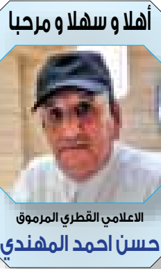
الاعلامي القطري المرموق حسن احمد المهدي