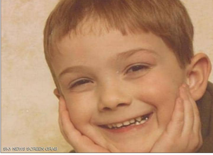
SKY NEWS SCREEN GRAB