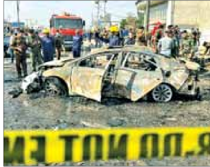
أخرى، بالقرب من أحد الجسور في البصرة. ولم تتهدد هجمات إرهابية منذ سنوات ومحافظه البصرة تعتبر هادئة أمنية طويلة.

قتل ٤ أشخاص وأصيب ٤ آخرون على الأقل، الثلاثاء، من جراء انفجار دراجة نارية مفخخة في مدينة البصرة جنوبي العراق. وفي حصيلة أولية، قالت خلية الإعلام الأمني في العراق استناداً إلى أرقام دائرة الصحة بالبصرة إن الانفجار أدى إلى مقتل ٤ أشخاص وإصابة ٤ آخرين. وأضافت خلية الإعلام الأمني في بيان أن الضحايا الذين سقطوا كانوا في مركبتين بالقرب من الدراجة النارية المفخخة. وكان مراسل "سكاي نيوز عربية" أفاد في وقت سابق بأن انفجار وقع من جراء انفجار دراجة نارية مفخخة في منطقة البصرة القديمة. ونقل عن شهود عيان قولهم إن الانفجار أسفر عن سقوط قتلى وجرحى. وأظهرت صور جرى تداولها النيران وقد اشتعلت في دراجة نارية وسيارة