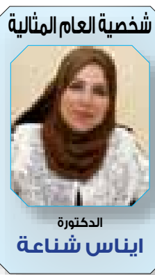
شخصية العام المثالية