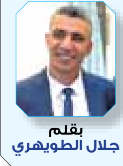
بقلم جلال الطويهي