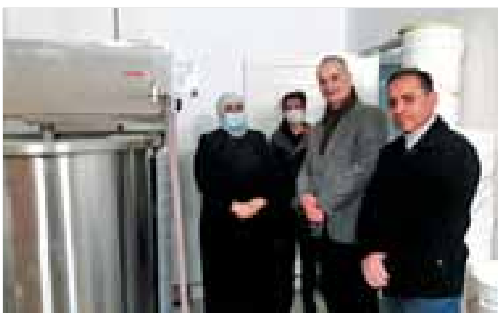
بعد إقرار مجلس الوزراء الاستراتيجية الوطنية للحركة التعاونية الأردنية للأعوام (2021-2025). وقال إن إدارة المؤسسة تدرس تقديم جملة من الجوائز لتشجيع أفراد المجتمع، وتحديد المتعطلين عن العمل للانخراط في العمل التعاوني، مشيراً إلى قيامها بتشبيك العلاقات مع المنظمات والجهات المانحة على المستويين الداخلي والخارجي، باعتبارها المظلة الرسمية للإشراف والرقابة على جميع التعاونيات في المملكة، وكذلك لضمان توزيع المنح على التعاونيات حسب الاختصاص، إضافة إلى ضمان