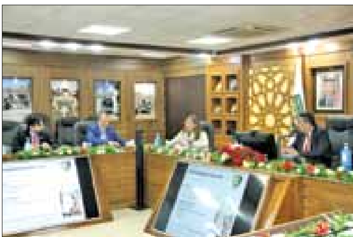
وخاصة المشاريع التي تهتم بالطاقة النظيفة ومعالجة المياه العادمة، مؤكدا دعمه لإقامة علاقة تشاركية مع البلقاء الأكاديمية بين الجانبين.

وبين الدكتور العجلوني، وفق بيان صادر عن الجامعة السبت، أهمية العمل والتنسيق المشترك في المجالات الأكاديمية والابتعاث والتشاركية، وخاصة في مشاريع المياه والطاقة النظيفة والمياه العادمة والبيئة، آملاً بأن يصب هذا اللقاء المثمر في إبرام مذكرة تفاهم بين الجامعتين يحدد فيها جميع المواضيع الأكاديمية بما فيها التخصصات المشتركة ومواضيع الابتعاث وتبادل الخبرات بين الطرفين. وأبدى وفد الجامعتين الأميركييتين إعجابهم بالمشاريع والمراكز في الجامعة