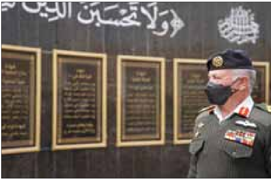
عليهم الرضا والرضوان وعظيم المغفرة والأجر وقرأ جلالته والحضور الفاتحة على أرواح الشهداء الطاهرة، فيما عزف الصداحون لحن

الرجوع الأخير. كما استعرض جلالته القائد الأعلى أسماء شهداء الوحدات والتشكيلات التي شاركت في معركة الكرامة، وزار معرضاً يحتوي على بعض الأسلحة المستخدمة في المعركة. والتقى جلالته الملك بعدد من المحاربين الذين أصيبوا في معركة الكرامة، وأطمأن على أوضاعهم، إذ أصرب جلالته عن فخره بهم وبكل المتقاعدين العسكريين والمحاربين القدامى، ونشأى القوات المسلحة الأردنية - الجيش العربي والأجهزة الأمنية، وبدورهم الكبير في خدمة الوطن والدفاع عن قضايا الأمة. وجسدت معركة الكرامة، التي قادها المغفور له، بإذن الله، جلالته الملك الحسين بن طلال، طيب الله ثراه، ميلاد فجر أردني جديد، عنوانه المجد والظفر ليظل الوطن مصاناً وأماناً ومستقراً بعزيمة نشأى الجيش العربي المرابط على حدوده، أحفاد من صنعوا النصر في معركة الكرامة، التي ستظل خالدة بتضحياتها وبطولاتها، وصفحة من صفحات الكبرياء الأردني، وعنواناً للتضحية والفضاء، وفضلاً مهماً في تاريخ الوطن والأمة.