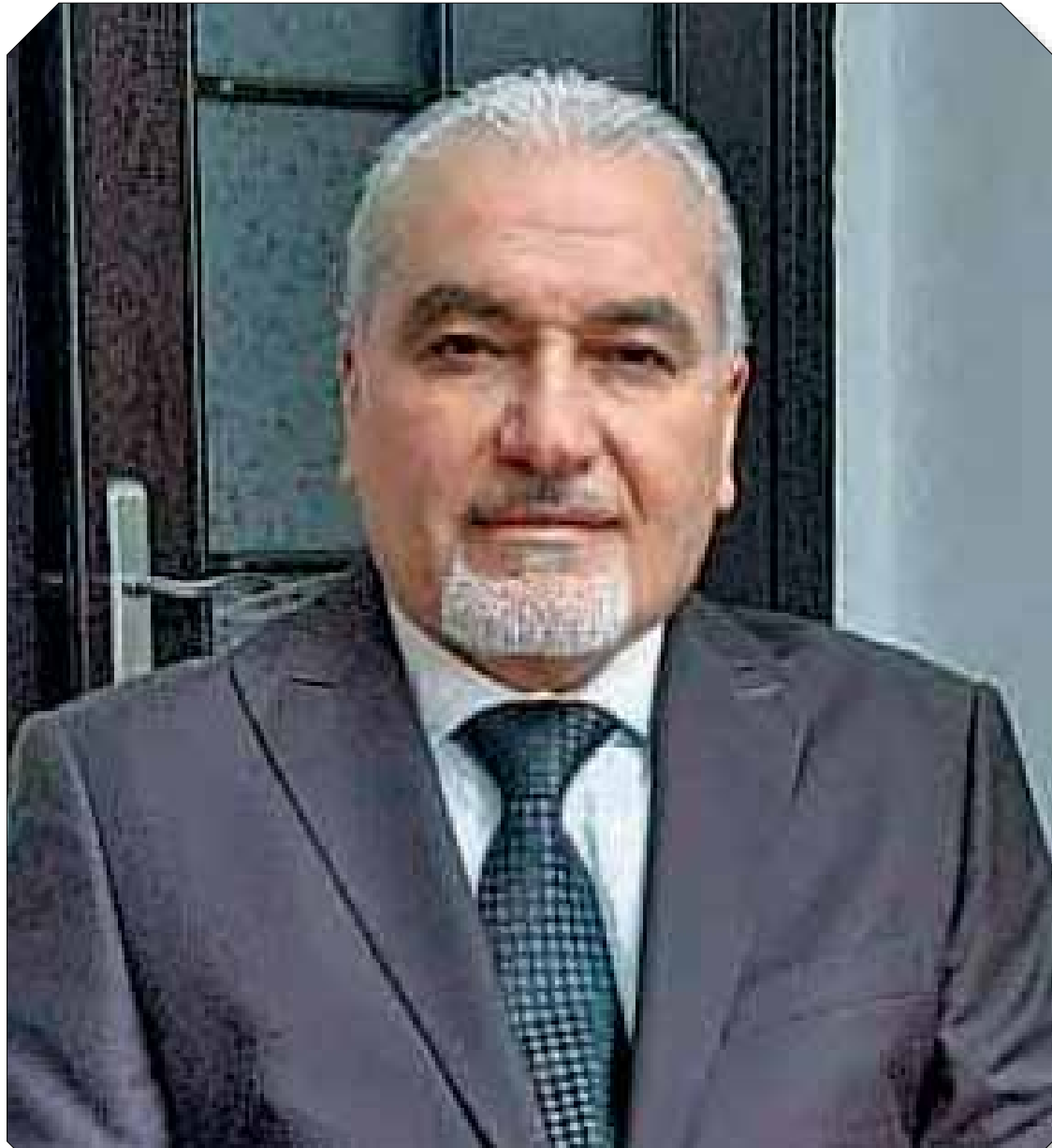
اعداد الدكتور ياسر ابراهيم خبير الطاقة المتجددة العالمي

سلطة الدولة و الجهات الحكومية المختصة في تنظيم هذه العملية لذلك يجب على الدولة الاخذ بما يلي -اصدار قوانين و تشريعات تنظيم العملية الفنية و التقنية في بناء المحطات الكهربائية الشمسية الخاصة و العامة