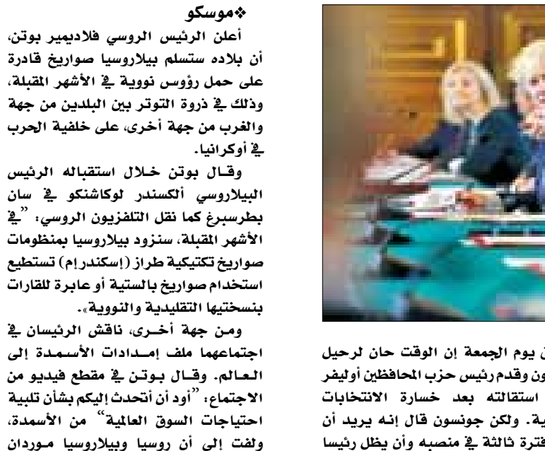
ويجب قواعد حزب المحافظين، لا يمكن إجراء تصويت على سحب الثقة من جونسون لمدة عام، ولكن الاستياء الساحق أو استقالة سلسلة من كبار الوزراء قد يضعف موقفه. كما أن بريطانيا في خضم أعمق أزمة تخص تكاليف العيشة منذ عشرات السنين بعد أن بلغ التضخم أعلى مستوياته منذ ٤٠ عاما. وقال مايكل هاوارد زعيم حزب المحافظين