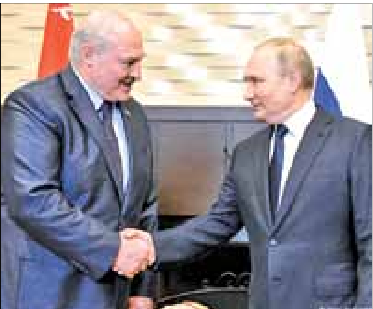
وعلى صعيد آخر، أعرب رئيس بيلاروسيا عن قلقه الشديد من تحليق طائرات حلف شمال الأطلسي (ناتو) القادرة على حمل رؤوس نووية، داعيا نظيره الروسي إلى تطوير مقاربات البلدين الجيفين ودعم قدراتهم الدفاعية.

وأضاف الرئيس الروسي قائلا: "سنعمل على ضمان الأمن ودولتنا وكل الدول المتعاونة معنا في معاهدة الأمن المشترك،