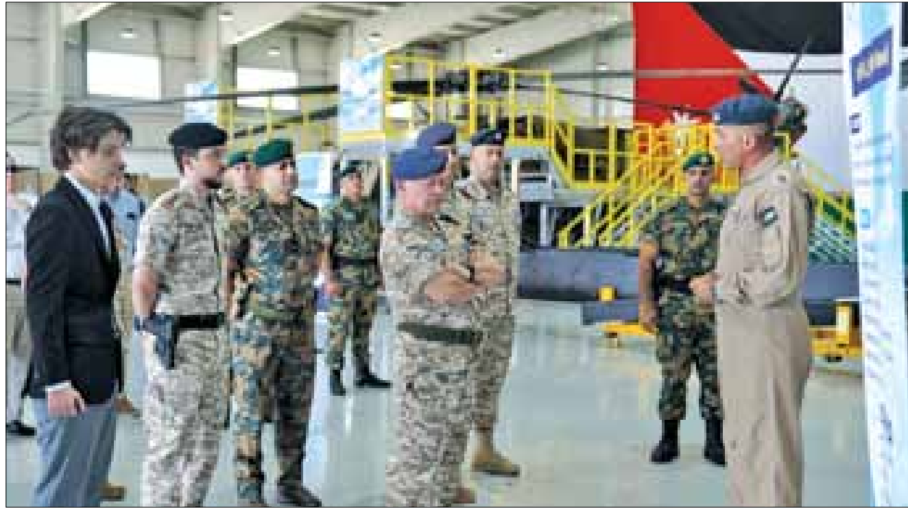
جناح الأمير الحسين بن عبدالله الثاني للاستطلاع الجوي، على عدد من الطائرات التي دخلت منظومة الجناح حديثا، والتي تعد من أحدث طائرات الاستطلاع الجوي المستخدمة حاليا في العالم. وأبرز المهام التي يقوم بها الجناح، ومختلف واجباته. وقدم قائد الجناح شرحاً أمام جلالة الملك حول

● ضرورة مواكبة التكنولوجيا بمجال الطيران العسكري