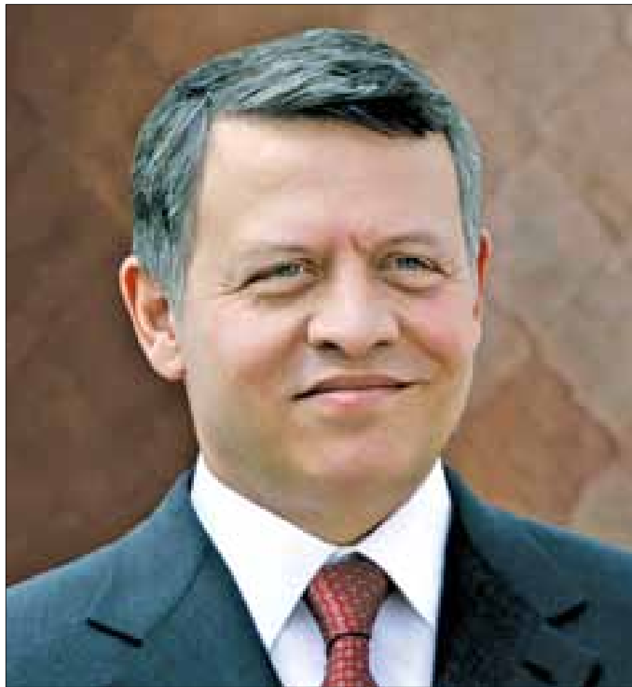
عمان غادر جلالة الملك عبدالله الثاني أرض الوطن، الأربعاء، في زيارة خاصة تستغرق عدة أيام. وأدى سمو الأمير الحسين بن عبدالله الثاني ولي العهد، اليمين الدستورية، نائباً لجلالة الملك، بحضور هيئة الوزارة.