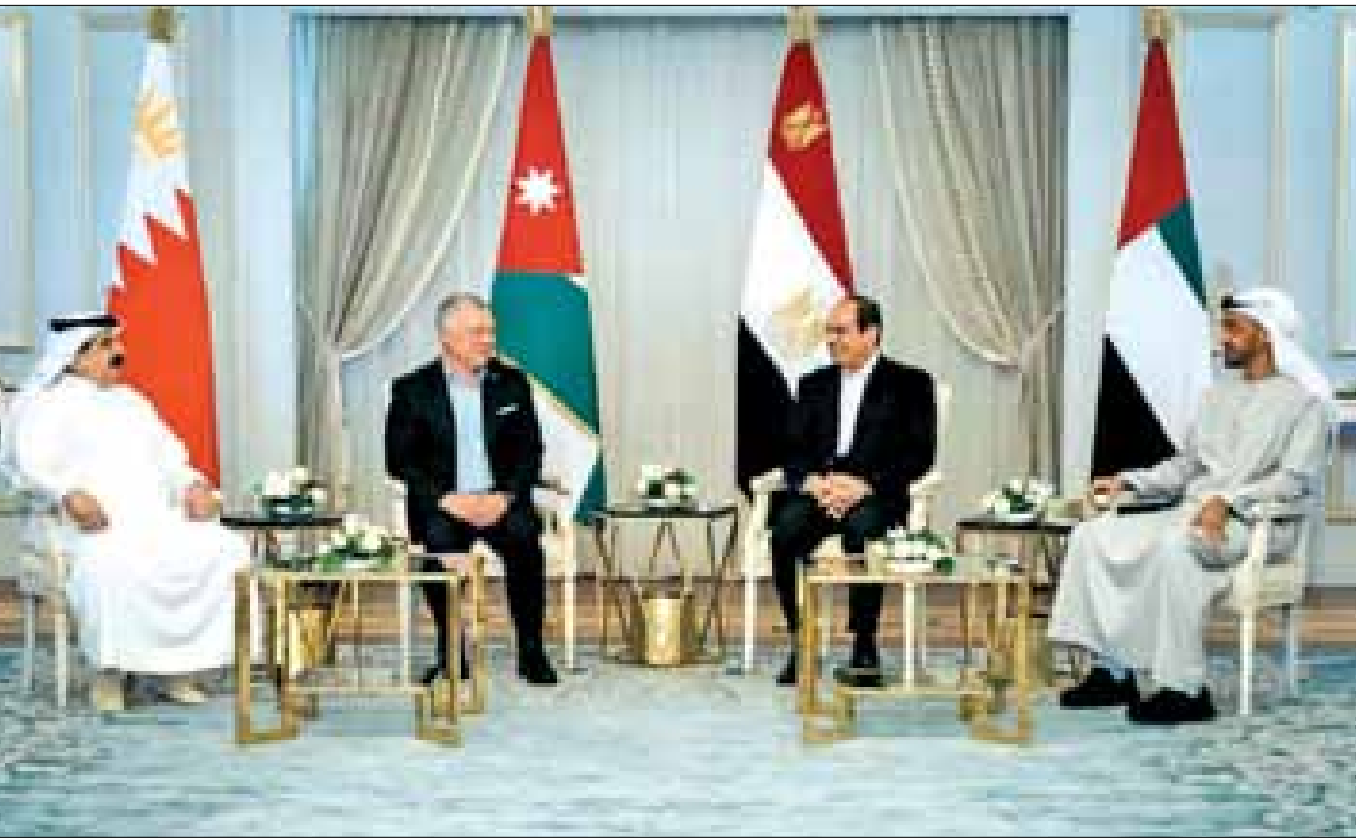
وحضر اللقاء عن الجانب الأردني رئيس الوزراء الدكتور بشر الخصاونة.

وتطرق اللقاء إلى عدد من الموضوعات ذات الاهتمام المشترك وخاصة في المجالات الاقتصادية والاستثمارية والتنموية لتعزيز التعاون والتنسيق