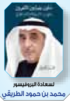
لسعادة البروفيسور محمد بن حمود الطريقي