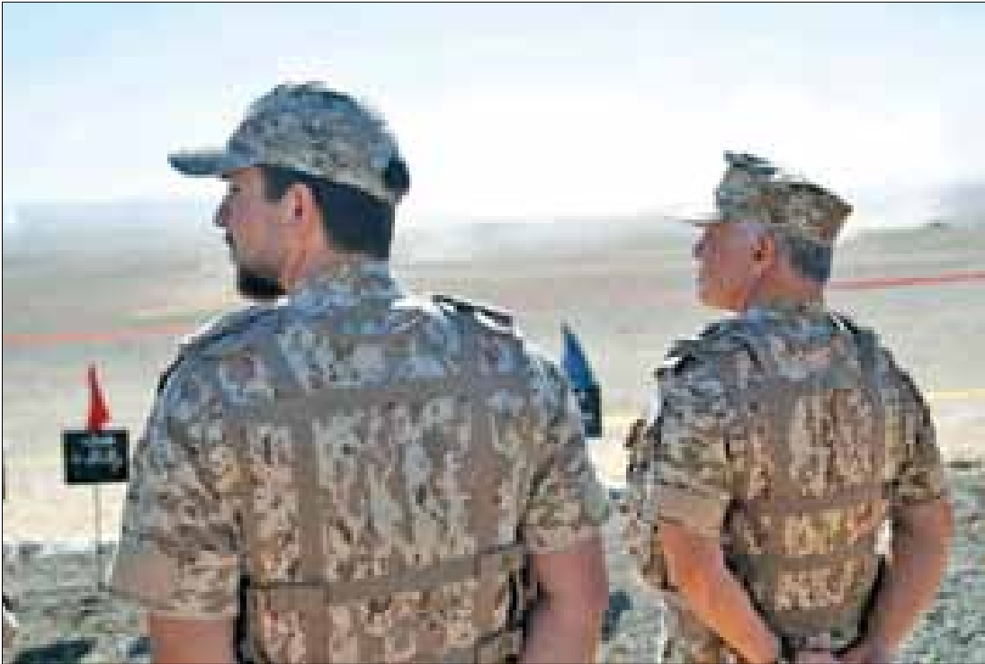
يهم والمعنويات العالية التي يتمتعون بها. البرامج التدريبية السنوية التي تنفذها القوات المسلحة وصولاً إلى أعلى مستويات الكفاءة والجاهزية والاستعداد القتالي لدى منتسبيها.

عمان تابع جلالة الملك عبدالله الثاني، القائد الأعلى للقوات المسلحة، وسمو الأمير الحسين بن عبدالله الثاني ولي العهد، الأربعاء، مجرياً تمريناً تعبويًا (النور الساطع)، الذي نفذته كتيبة الأمير الحسين بن عبدالله الثاني/الملك، إحدى وحدات المنطقة العسكرية الوسطى. واستمع جلالتهم، بحضور رئيس هيئة الأركان المشتركة اللواء الركن يوسف أحمد الحنيطي، إلى إيجاز قدمه قائد المنطقة العميد الركن توفيق المرزوق، عن أبرز ما يشمله التمرين، الذي أقيم في أحد ميادين التدريب المتخصصة. واشتمل التمرين على فرضيات تحاكي سيناريوهات متوقعة، وهجوم مدبر (مشاة راجلة) بإسناد مدفعي وجوي، بهدف تدريب المشاركين على مختلف المستويات العملية واللوجستية والتدريبية، وكيفية التخطيط والتنسيق والتنفيذ وصولاً للأهداف المرجوة. وأبدى جلالتهم اعتزازهم بالمستوى المتميز والاحترافية العالية للمشاركين في التمرين في تنفيذ الواجبات المناطة