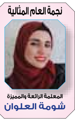
نجمة العام المثالية