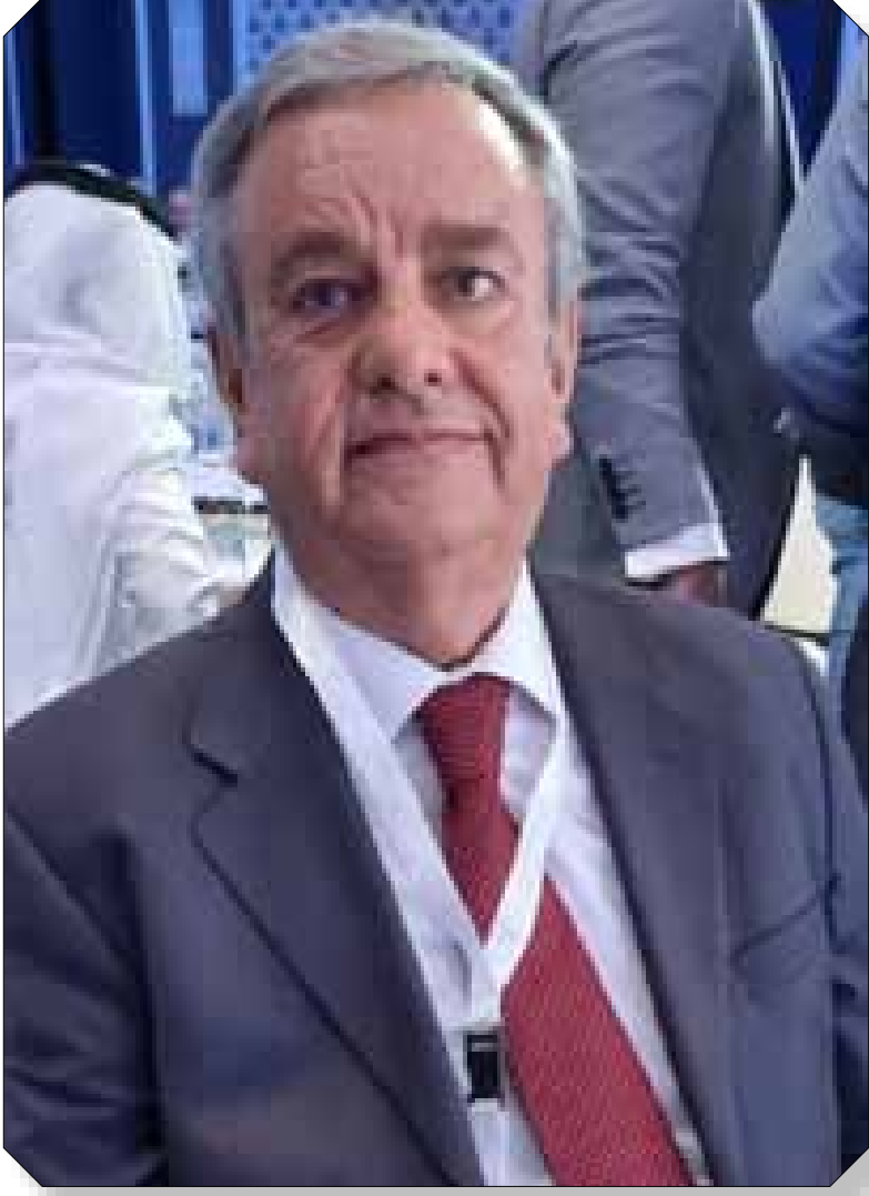
سعادة النقيب شربل قرقماز مستشار الهيئة العليا للمجلس الاقتصادي العربي