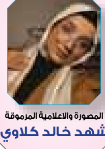
المصورة والاعلامية المرموقة شهد خالد كلاوي