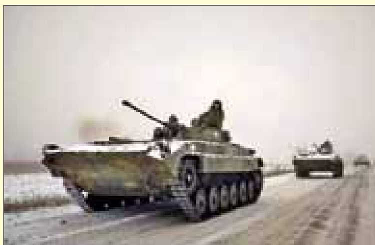
لتعزيز مكاسبها - وربما شن هجومها المضاد، "أن البيت الأبيض طلب من فريق زيلينسكي وفق "بوليتيكو". الاستعداد للهجوم، حيث تندفق الأسلحة والمساعدات من واشنطن وأوروبا..

وكالات في الوقت الذي تقترب فيه الذكرى السنوية الأولى لبدء العملية العسكرية الروسية الخاصة في أوكرانيا، ذكر موقع "بوليتيكو"، أن الإدارة الأميركية طلبت من الرئيس الأوكراني فولوديمير زيلينسكي الاستعداد للهجوم. وقال المصدر إن الرئيس الأميركي جو بايدن سيلقي، يوم الثلاثاء، خطاباً في بولندا، يؤكد فيه مرة أخرى ادانة العملية العسكرية الروسية في أوكرانيا، كما سيلعب بوضوح أن الولايات المتحدة ستدعم كييف حتى اللحظات الأخيرة من الصراع. وأضاف أن المسؤولين الأميركيين يعتقدون أن القوات الأوكرانية "على وشك الوصول إلى مرحلة حرجية، حيث تستعد روسيا لشن هجوم جديد. بالتزامن مع ذلك، تضغط إدارة بايدن بشكل عاجل على إدارة الرئيس الأوكراني