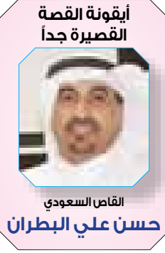
القاص السعودي حسن علي البطران

أعلنت وزارة الخارجية وشؤون المغتربين أنه واستمراراً بتنفيذ التوجيهات الملكية السامية بتقديم المساعدة للأشقاء في الجمهورية العربية السورية، والجمهورية التركية جراء الزلازل الأخيرة، قامت الهيئة الخيرية الأردنية الهاشمية بتسيير قافلة مساعدات برية مكونة من 7 شاحنات إلى سوريا. الأحد، محملة بمستلزمات إغاثية وطبية تم تسليمها من خلال نظام النقل التبادلي في مركز الحدود الأردنية السورية (جابر - نصيب)، لإيصالها للمتضررين من الزلازل.