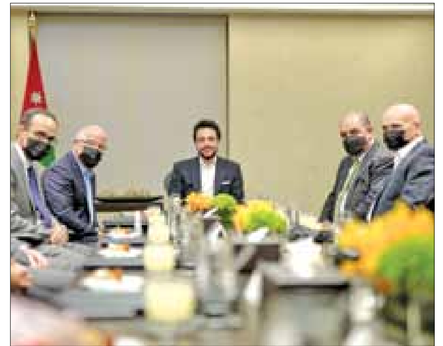
الملك يستذكر شجاعة الحسين والأردنيين في تعريب قيادة الجيش

عمان اطلع سمو الأمير الحسين بن عبدالله الثاني ولي العهد، الأربعاء، على خدمات شركة ProgressSoft، المتخصصة في برمجة الحلول المالية والمدفوعات الفورية. واستمع سموه خلال زيارته المقر الرئيسي للشركة في عمان إلى إيجاز قدمه المدير التنفيذي والشريك المؤسس للشركة المهندس ميشيل وكيلة حول الخدمات التي تقدمها الشركة لأكثر من ٣٧٠ مؤسسة في ٢٤ دولة، ومخطط نموها.