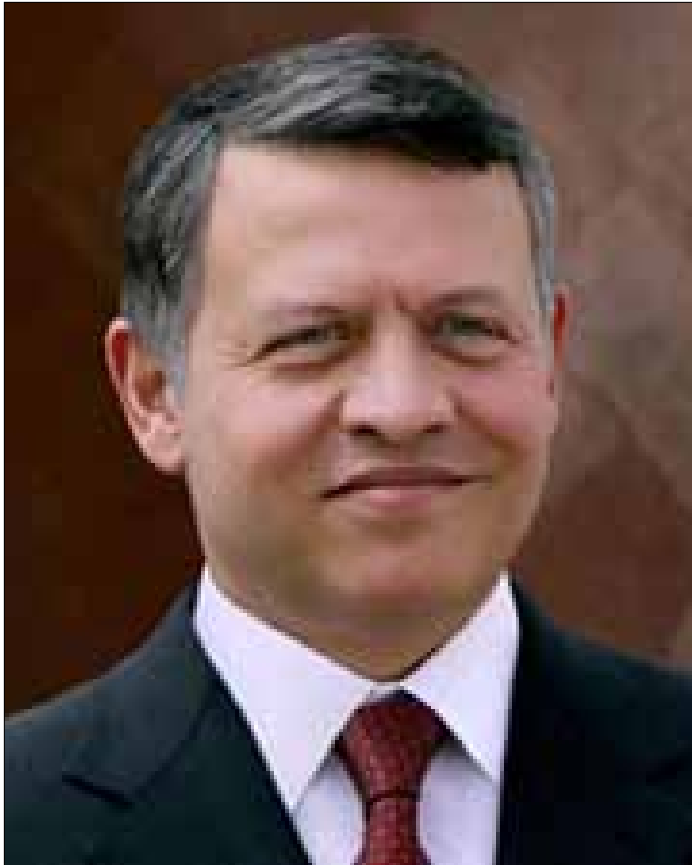
الملك محمد السادس ملك المغرب يهنئ ولي عهد أبوظبي بمناسبة تعيينه

❖ عمان هنا جلالة الملك عبدالله الثاني، هاتفا الخميس، سمو الشيخ خالد بن محمد بن زايد آل نهيان، بمناسبة تعيينه وليا للهد في إمارة أبوظبي. وأعرب جلالة الملك عن تمنياته لسمو الشيخ بدوام التوفيق والسداد في خدمة دولة الإمارات العربية المتحدة الشقيقة وشعبها العزيز، في ظل قيادة سمو الشيخ محمد بن زايد آل نهيان رئيس دولة الإمارات العربية المتحدة. وأكد جلالاته عمق العلاقات المتينة والراسخة التي تجمع البلدين والشعبين الشقيقين، والحرص على توطيدها في شتى الميادين. وأجرى نائب رئيس الوزراء وزير الخارجية وشؤون المغتربين أيمن الصفدي، اتصالا هاتفيا مع وزير خارجية دولة الفاتيكان المطران بول ريتشارد غالاجير، نقل خلاله تحيات جلالة الملك عبدالله الثاني إلى قداسة البابا فرنسيس وتمنيات جلالاته لشدته بالشفاء العاجل من الوعكة الصحية التي ألمت به. ويبحث الصفدي والمطران غالاجير العلاقات الثنائية وعدد من القضايا ذات الاهتمام المشترك، وفي مقدمها القضية الفلسطينية. وأكد الوزيران الحرص المشترك على استمرار التشاور والتنسيق في إطار العلاقات التاريخية التي تربط المملكة والفاتيكان، وعلى تعزيز التعاون في جهود تحقيق الأمن والاستقرار والسلام في المنطقة.