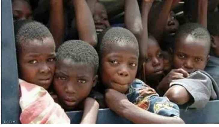
مقتل 190 طفلا في 11 يوما