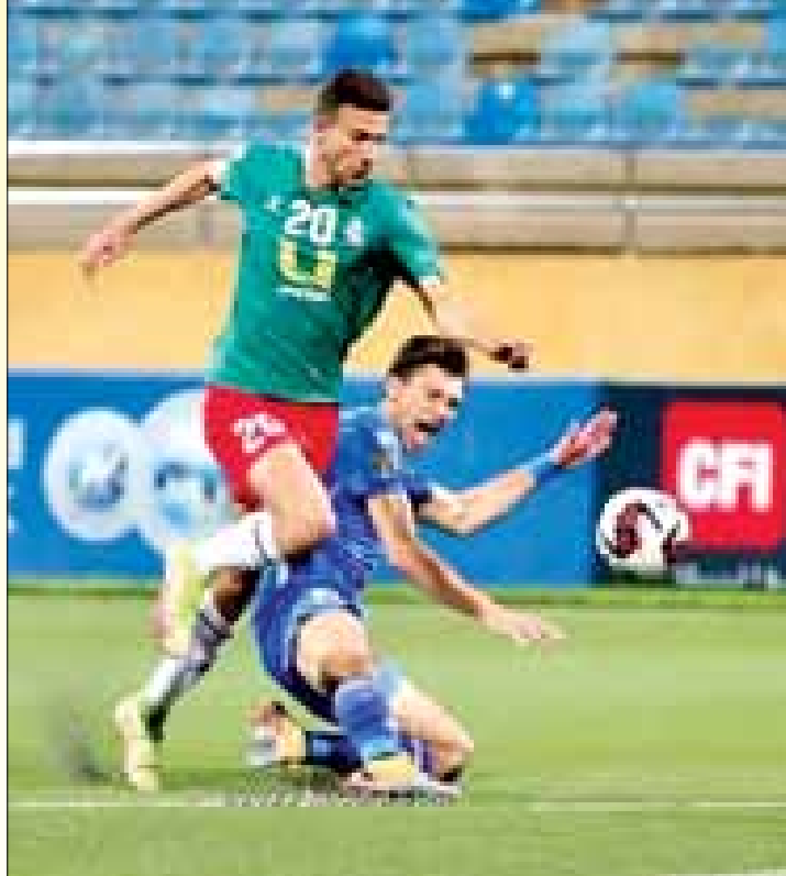
وضغط الرمثا في الدقائق الأخيرة بحفاظ على هدف الفوز الثمين حتى بشكل مكثف، لكن الوحدات استطاع أن يهزمه.