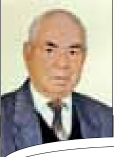
برقاش... مسار الشمال السياحي