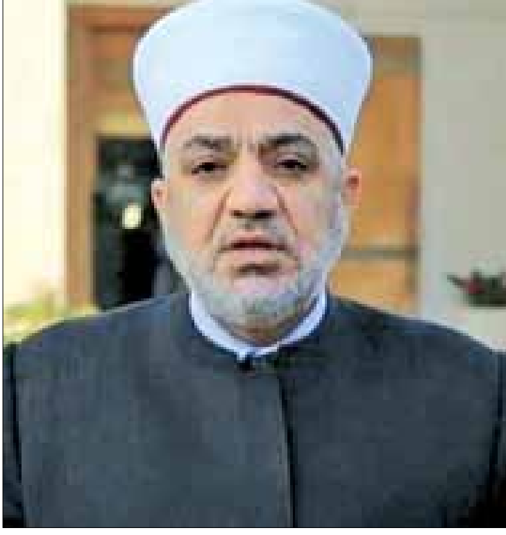
الأوقاف وكوادرها لحجاج "٤٨"، مُشيداً وراقق الوزير الخلية خلال جولته بمستوى الخدمات وتعاون كوادر بعثة أعضاء البعثة الإعلامية، وعدد من مسؤولي الوزارة ودائرة الحج والعمرة.