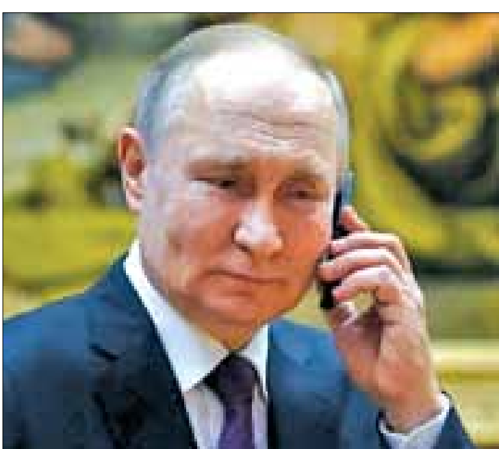
مكتبه: "الآن هو الوقت الذي يمكن أن تسفك فيه دماء.. لذلك (... فإن أرتالنا تعود أدرجها إلى العسكرية الميدانية وفقاً للخطط". وكانت الرئاسة البيلاروسية قد أعلنت عن موافقة قائد فاغنر على "اتفاق يضمن سلامة مقاتلي فاغنر مطروح للنقاش". وقالت إن رئيسها لوكاشينكو تحدث إلى رئيس فاغنر وأنه يتصرف بناء على اتفاق مع الرئيس الروسي فلاديمير بوتين.