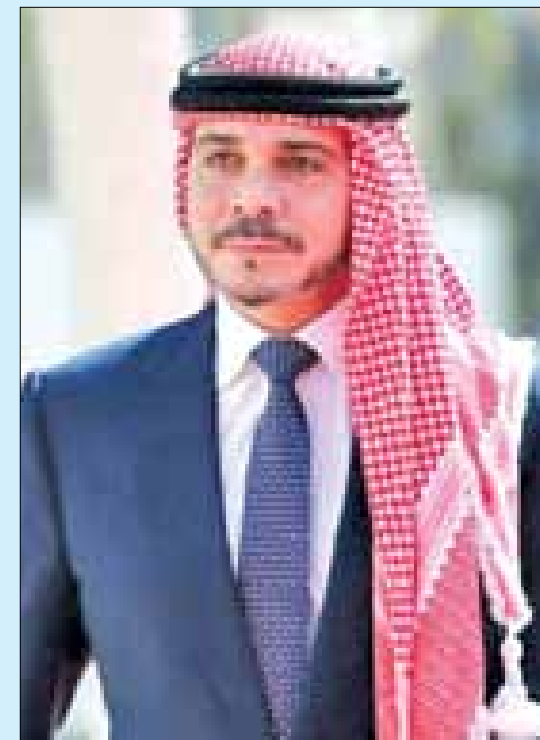
عمان أدى سمو الأمير علي بن الحسين، الثلاثاء، اليمين الدستورية نائباً لجلالة الملك، بحضور هيئة الوزارة.