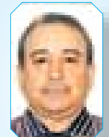
البروفيسور صباح جاسم صفحة ٨