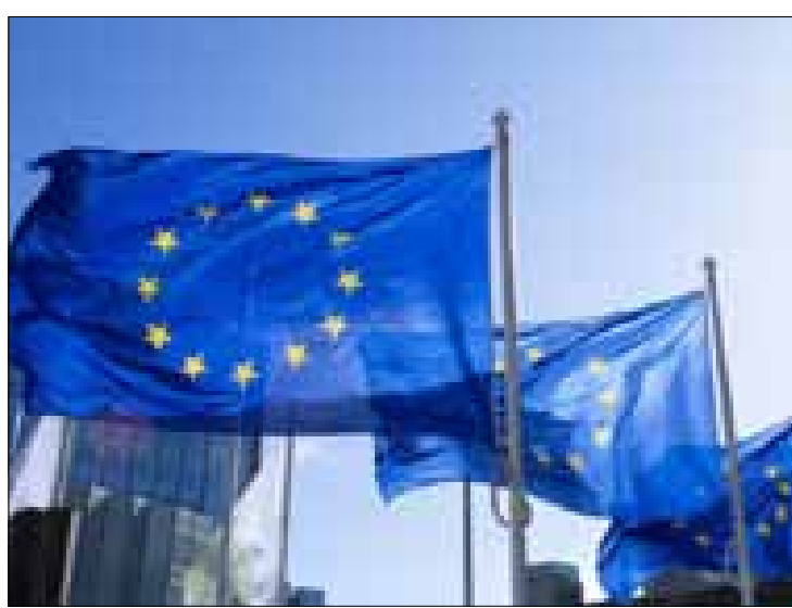
الصواريخ عبر سلاسل التوريد والقيمة. شكل منح تساهم في جهود صناعة الدفاع الأوروبية لزيادة قدراتها الإنتاجية.