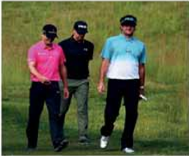
على جهاز المشي بعد نهاية الساعة الأولى والثلاث كالتالي، كان مع إضافة ثلاث دقائق من المشي لا يخطأ خلال اليوم. كما أن المشي على جهاز المشي لمدة ساعة واحدة يمدد الحياة حتى 10 سنوات إضافية.

قرأ أيضا تعرف إلى التغييرات التي تحدث في الجسم كل 10 سنوات كما أن العلماء استلخوا على وجه الخصوص من الوسائل الأسفلية المتغيرة. كما أظهرت دراسة نشرت في دورية جمعية القلب الأمريكية لفحص مدى تأثير المشي المنتظم على كبار السن قد يستفيدون بشكل خاص من المشي المنتظم.