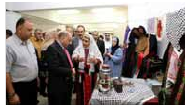
بالتفاهم والقيادة والقائد، وجمال الحضور على معرض الجمعيات الخيرية الذي اشتمل على متونجات الجمعيات من حرف يدوية ولحيم البدوية والاكسسوارات والتحف وخزف وتهديب للشمع ومناظر الفس

وتابع الحضور السامر الأردني والأغاني والأهازيج الفلسطينية، كما قدمت مجموعة الكشافة الأغاني التراثية الوطنية الأردنية التي تتغنى