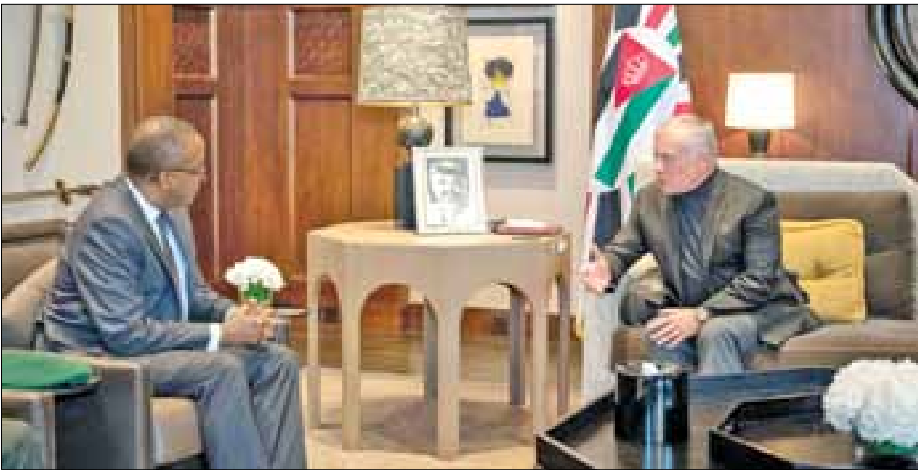
الملك محمد السادس مع الرئيس الرواندي بول كاغامي في لقاء في الرباط. حضر اللقاء وزير الصناعة والإنتاج الصيدلاني الجزائري.