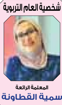
سمية القطاونة المعلمة الرابعة

اشتكى مواطنون في مدينة العقبة، من انقطاع التيار الكهربائي عن عدة مناطق في المدينة، منذ ساعات ما بعد عصر السبت، وشمل الإنقطاع مناطق التاسعة والعاشر والثامنة والسادسة ووفقا لعاملين في شركة الكهرباء، فإن انقطاع التيار، يأتي بسبب زيادة في الأحمال وحدوث ضغط على الشبكة، في الوقت الذي تقوم فيه كوادر شركة الكهرباء، بالعمل على معالجة الأعطال، لإعادة التيار الكهربائي.