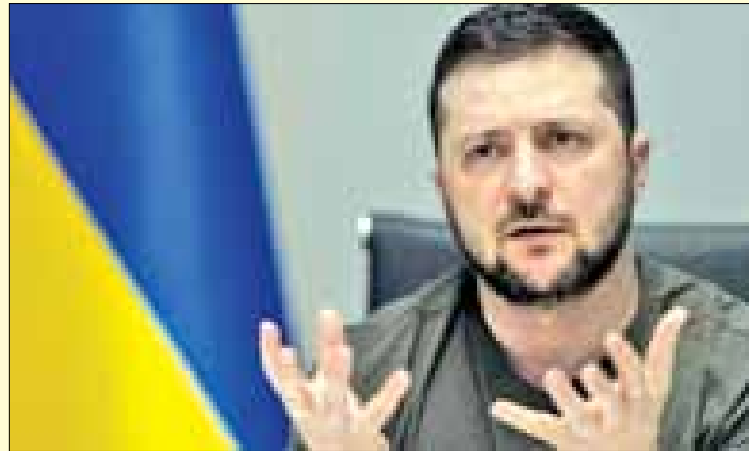
أوكرانية مستودعا للخيرة في شبه جزيرة القرم وألحقت أضرارا بجسر مضيق كيرتش لروسيا. تابع ص 4

أعلنت روسيا، السبت، أنها أسقطت 20 طائرة مسيرة أوكرانية بالقرب من شبه جزيرة القرم. وقالت وزارة الدفاع الروسية على Telegram إن أنظمة الدفاع الجوي دمرت 14 طائرة مسيرة بينما تم إخضاع ست طائرات أخرى بوسائل الحرب الإلكترونية. وأضافت أنه لم تقع إصابات أو أضرار. وفي موسكو، قال مسؤولون، إنهم دمروا طائرة مسيرة كانت تستهدف العاصمة، في أحدث هجوم على المدينة خلال الأيام الأخيرة. وقالت وزارة الدفاع إن طائرة مسيرة أوكرانية دمرت فوق المناطق الغربية لموسكو، مضيفة أنه لم تقع إصابات أو أضرار. وفي تموز/يوليو، استهدفت مسيرات