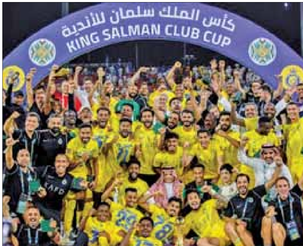
قاد رونالدو نادي النصر السعودي للتتويج ببطولة الأندية العربية للأبطال (كأس الملك سلمان) على حساب الهلال.