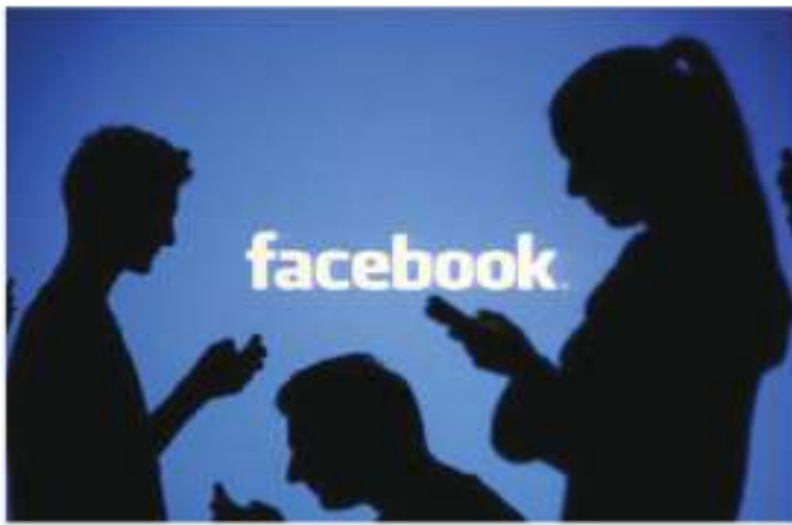
من قبل الشبكات الاجتماعية لشركة "فيسبوك". ومبرر اللجنة الوطنية ممثلي شركة فيسبوك -وهذا البلاغ- عن استعدادها

وأشار البلاغ إلى أن اللجنة أكدت، أيضا، على تزايد الوعي مع الشركة، حول التطورات الحالية والمستقبلية في العالم واستخدامات التكنولوجيا الرقمية (الاستخدامات الجديدة، تصنيف الخوارزميات الغامضة للتفسير الذكاء الاصطناعي المسؤول، مسير حسابات الأشخاص بعد الوفاة...)، وخلص المصدر ذاته إلى أن اللجنة الوطنية طلبت من ممثلي شركة فيسبوك أن تتم دراسة مختلف طلباتها، وأن تقترح خطة عمل فعالة قادرة على الاستجابة لختلف هذه الواضخ.