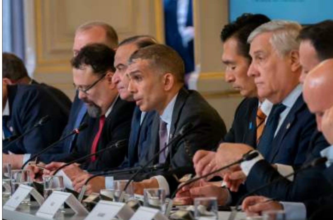
الأمير راشد بن فيصل آل سعود يشارك في مؤتمر إنساني حول غزة في باريس.

تحتل 45 طناً إضافياً من المساعدات، نظمتها وكالة إغاثة وتشغيل اللاجئين الفلسطينيين (الأونروا) بالتعاون مع الهيئة الخيرية الأردنية الهاشمية.