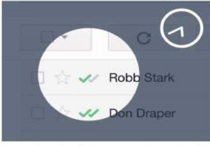
بكتابة بريد إلكتروني، إذ هذا الترميز موجود في أسفل اليمين.

جمعنا لك رسائل البريد الإلكتروني تحتوي على نص أو فقرات قد تتكرر أحيانا في العديد من الرسائل التي نرسلها عادة، لذلك يوجد على اليمين ميل قسم يمكن للمستخدم من إلقاء كتل نصية بشكل افتراضي، وإمكانه فيما بعد إضافتها إلى مجال كتابة البريد الإلكتروني باستخدام قائمة فرعية، حيث تظهر قائمة بجميع النصوص المحفوظة، مما يمكن في الوقت نفسه من توفير الوقت وتبسيط المهام الإدارية، وأوضحت الصحيفة، تاننا، أنه بإمكان المستخدمين العمل على Gmail دون إنترنت، وبعد هذا الخيار في غاية الأهمية إذا كنت تتنقل خارج مكان العمل كثيرا وتضطر أحيانا إلى الوصول إلى مكان لا يوجد فيه اتصال بالإنترنت في الوقت الذي تحرر فيه بريدك الإلكتروني، يفضل هذه الخاصية، بإمكانك كتابة بريد إلكتروني وإرساله فيها بعد صد الاتصال ثانية بشبكة الإنترنت.