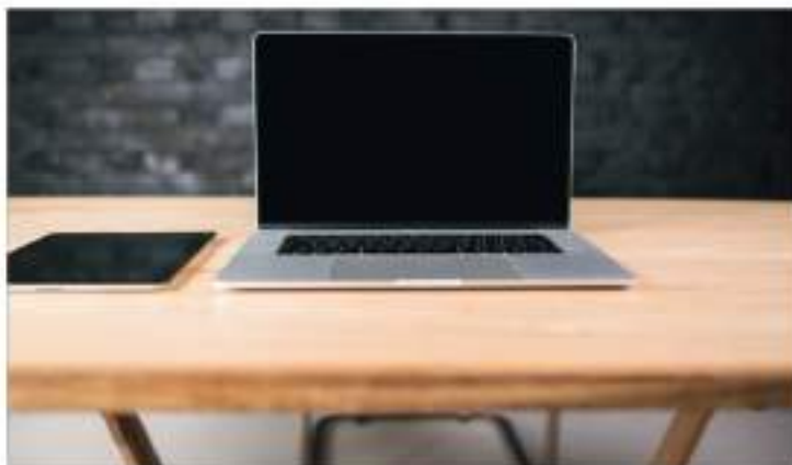
نسخة مايكروسوفت ويندوز القديمة، وفي هذه الحالة، يعمل الاختيار غير المناسب لبرنامج مكافحة الفيروسات على إبطاء جهاز الكمبيوتر، ويقلل من فرص ضمان حماية موثوقة للجهاز.

التي يمكن أن تبطن من سرعة عمل النظام إلى حد كبير، من هذا المنطلق، من الممكن نقل بعض المعلومات والبيانات إلى محرك القرص الصلب القابل للإزالة، الأمر الذي ينتج لجهاز الكمبيوتر القيام بهامه بشكل أسرع، ويعمل على توفير مساحة كبيرة لتخزين الملفات، وفي حال كنت لا تحتاج إلى ميزة التشغيل التلقائي للجهاز، فمن الضروري الغائها، وهو ما سيسهم في تشغيل الجهاز بشكل سريع، وتثبيت المهام بشكل أسرع وكفاءة أكبر. وأشار الموقع إلى خطأ كبير يرتكبه الكثيرون منا، ويؤثر سلبا على سرعة جهاز الكمبيوتر، ويتمثل في تشغيل وضع السكون على الجهاز بدلا من إيقاف تشغيله ليلا، في الواقع، يمكن القيام بذلك في بعض الأحيان، إلا أن الأضرار لا تقل عن تلك التي يسببها تشغيل الجهاز، وعلى قدرته على التعاطي مع المهام، لذلك، يجب إيقاف تشغيل الجهاز، لضمان حصوله على القليل من الراحة، ما يعزز معدل سرعته، علاوة على ذلك، يساعد تثبيت برنامج «سي كلينر» الذي يستخدم تحسين أداء الحاسوب وتطبيقه بشكل سريع، فضلا عن تنظيف السجل وحذف الملفات المؤقتة والتخلص من الأخطاء في النظام، وكذلك أداء عدد من المهام، فهو الموقع بأن نظام التشغيل يقدم غالبا برامج تشغيل تلقائية، وغالبا ما تكون مناسبة فقط لأحدث الموديلات من أجهزة الكمبيوتر، لكن في حال كان عمر جهازك قد تجاوز ثلاث سنوات فحجب تثبيت هذه البرامج، وقم بإلغاء برنامج التشغيل التلقائي، للحفاظ على الجهاز، وضمان قيامه بهامه بشكل سريع.