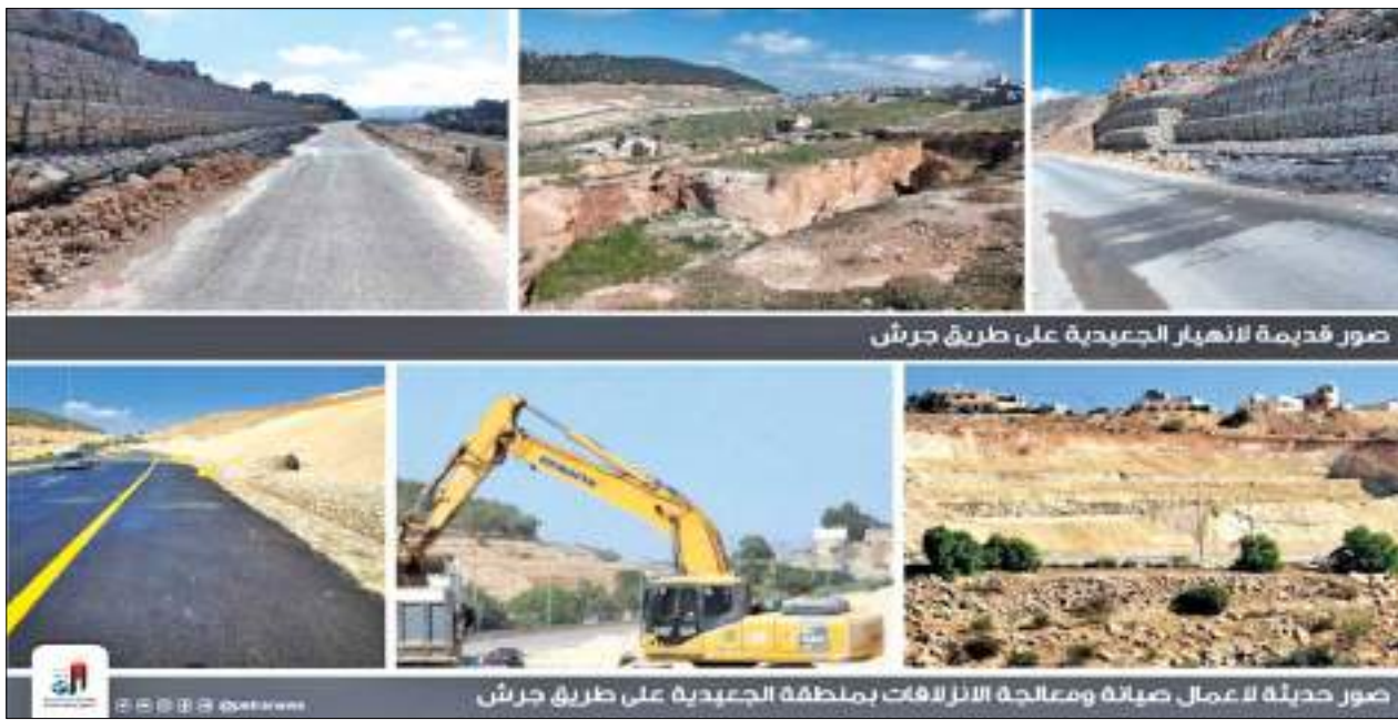
صور قديمة لانهار الجميدية على طريق جرش