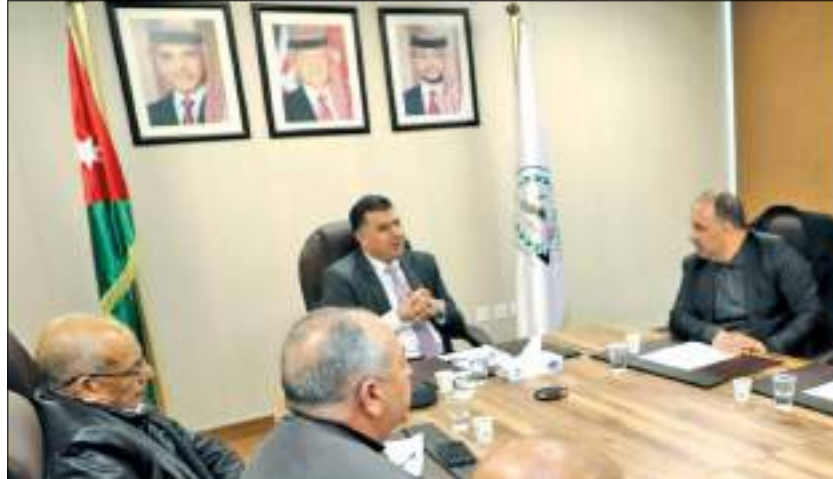
المعالجة التي تنتجها الشركة الوطنية للدواجن في زراعة ٢٢٠٠ دونم.

وأشار إلى خطة التحريج الوطنية والإنجاز المستمر للغابات الصناعية في جميع محافظات المملكة، مستعرضاً مسار الإنجاز لغاية اليوم الذي تم تحقيقه بفضل لواء القطرانة، الذي تم تحقيقه من خلال خطة الاستدامة عبر استغلال المياه